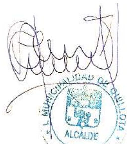
Firmado Digitalmente por OSCAR CALDERÓN SÁNCHEZ ALCALDE MUNICIPALIDAD DE QUILLOTA