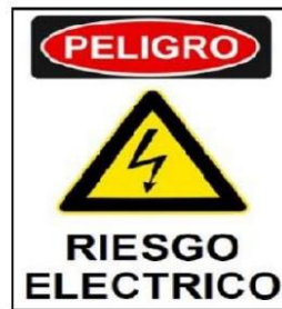
Simbología de riesgo eléctrico

Para las conexiones de conductores fases y T.S./T.P. se consultan barras de Cu desnudas montadas en aisladores de resina, las cuales estarán protegidas con mica protectora transparente para impedir contactos directos e indirectos, esta mica debe contar con la simbología de riesgo eléctrico especificada en la siguiente imagen: